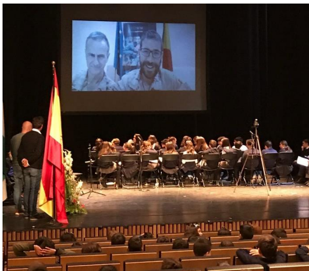
videoconferencia Campaña educar para vencer”: UE-EUTM-Malí con Colegio “San Pedro Crisólogo

Estos ciclos socio-culturales están patrocinados por el Ministerio de Defensa a través de la Dirección General de Política de Defensa (División de Coordinación y Estudios de Seguridad y Defensa), como medida para promoción, difusión y fomento de la Cultura de la Defensa.