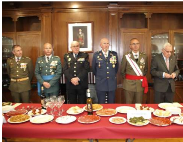
ENTREGA DEL PREMIO REAL HERMANDAD.