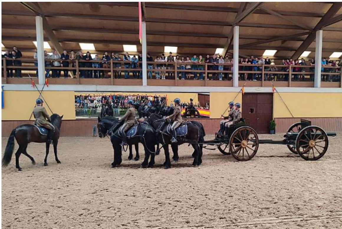
Unidad de artillería hipomóvil de la Guardia Real

Durante el desarrollo del mismo se pudo constatar una gran asistencia de ganaderos, curiosos y aficionados, encontrándose las gradas de las instalaciones repletas de un público que quedó gratamente impresionado por la magnífica imagen que los animales presentados mostraban.