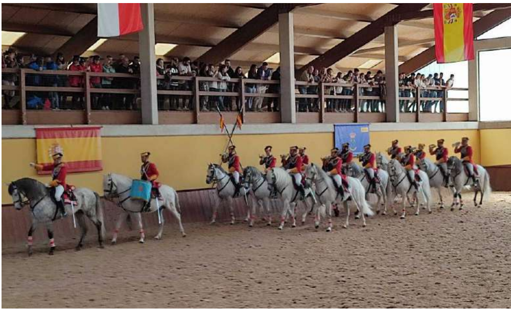
Banda de Clarines y Timbales de la Agrupación de Reserva y Seguridad de la Guardia Civil

Un año más, en el Centro Militar de Cría Caballar en Mazcuerras, junto a la localidad de Ibio, ha tenido lugar en el día de hoy una jornada de puertas abiertas. Como en anteriores ocasiones la jornada se inició a las 11,30 horas, con los acordes del Himno Nacional, teniendo el acto una duración de aproximadamente hora y media. Durante este