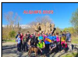
Foto de familia

Comida: Restaurante: El Hogar de Ferreira Nº de participantes: 30