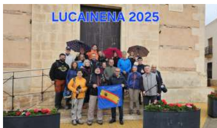
Foto de familia