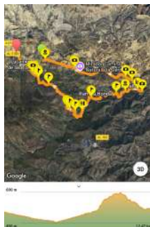
Mapa de la ruta