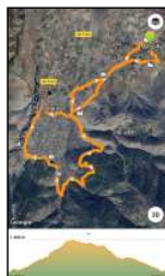
Mapa de ruta