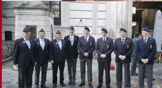
Arriado solemne de Bandera, XX Aniversario Traslado JIAENOR de La Coruña a Valladolid: