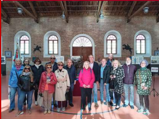
Exposición Uniformes ACAB: