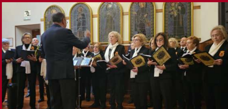
Misa por los socios fallecidos en 2025: