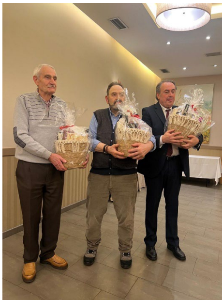
Los tres agraciados con los lotes Navideños de 2025. Felicidades compañeros