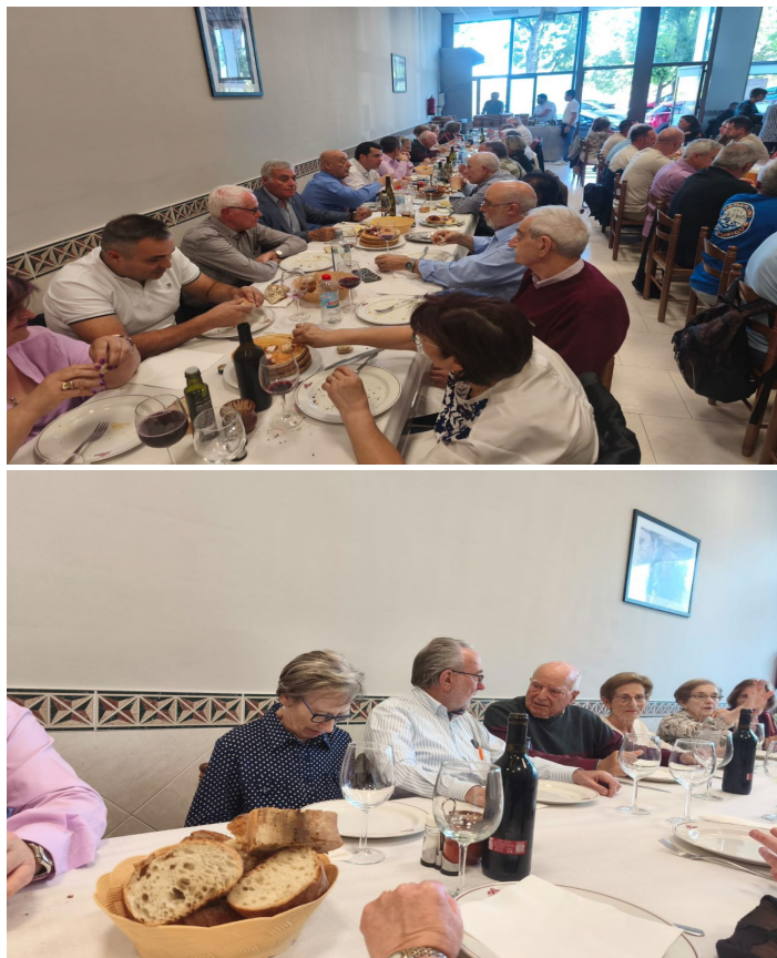
La reunión resultó muy amena