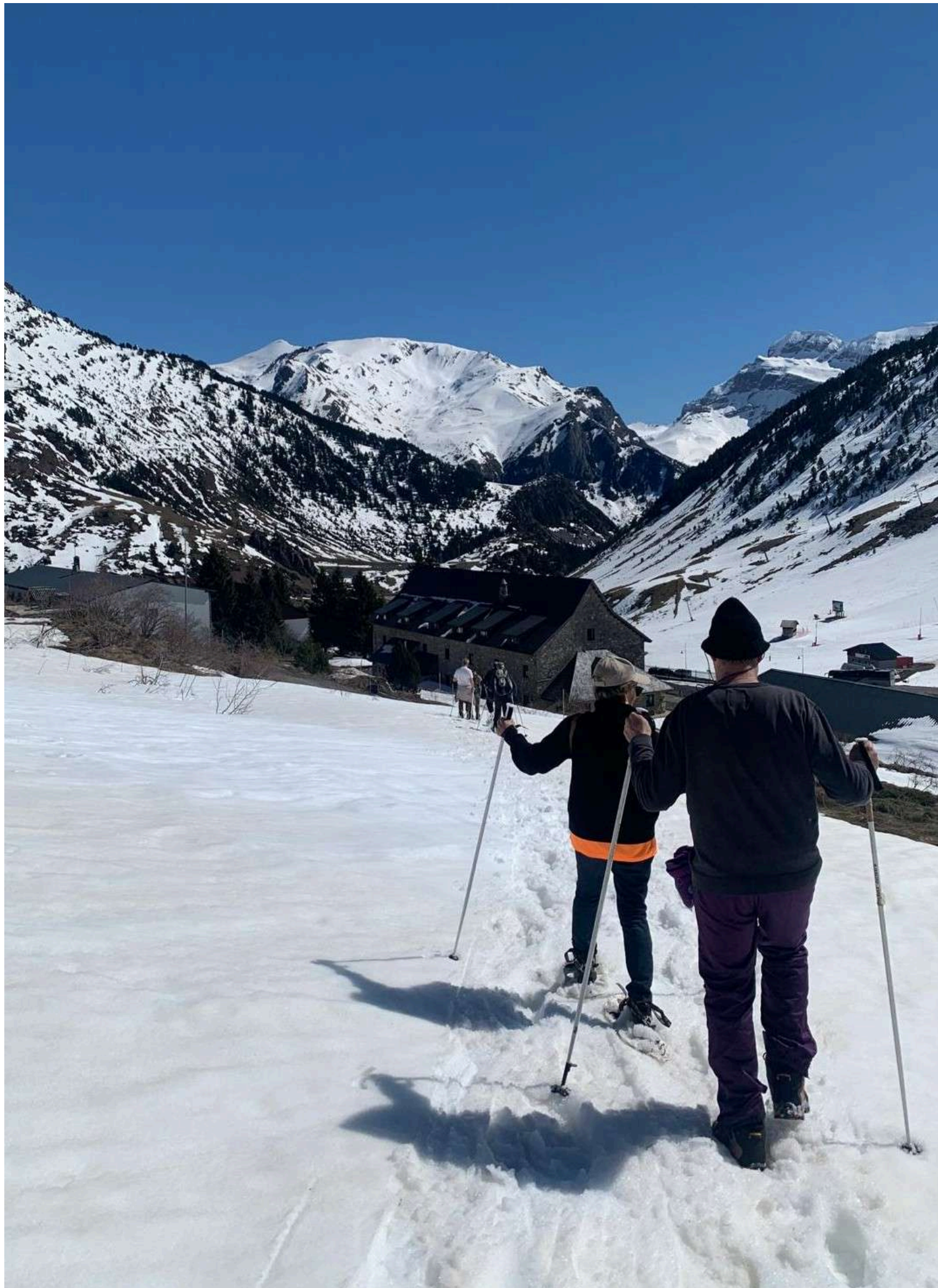
Llegando al Refugio Militar de CANDANCHÚ. Izq a dcha: espolón del monte LA RACA, Canal Roya, pico Anayet, monte LAS NEGRAS, Canal de Izas, pico IP y espolón del monte TOBAZO