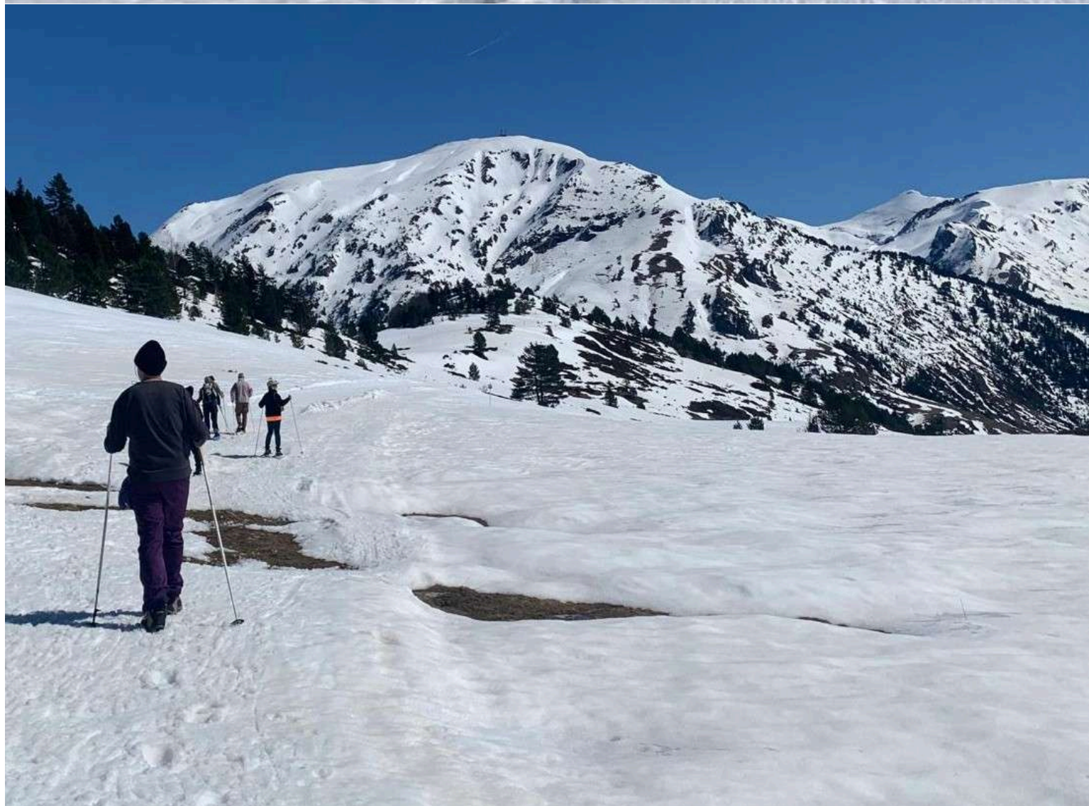
Regreso. Al fondo monte LA RACA (a su izq estación de esquí ASTÚN), dcha pico ANAYET y LAS NEGRAS