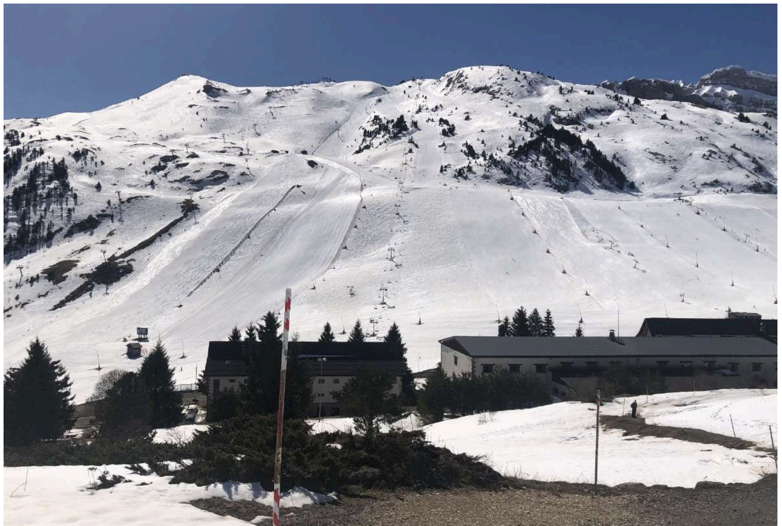
Refugio Militar de CANDANCHÚ. Estación de Esquí. Pistas del monte TOBAZO (arrastres y telesillas). Abajo las raquetas de nieve utilizadas en la actividad.