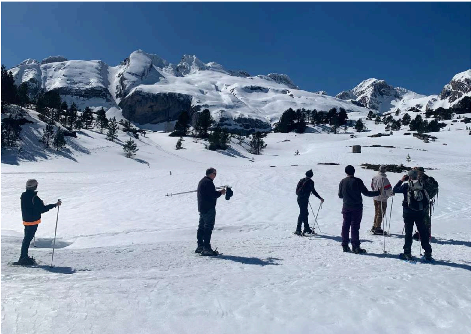
Centro LA ZAPATILLA, a su izq TUBO de la Zapatilla, a dcha pico ASPE. Abajo, izq LA ZAPATILLA