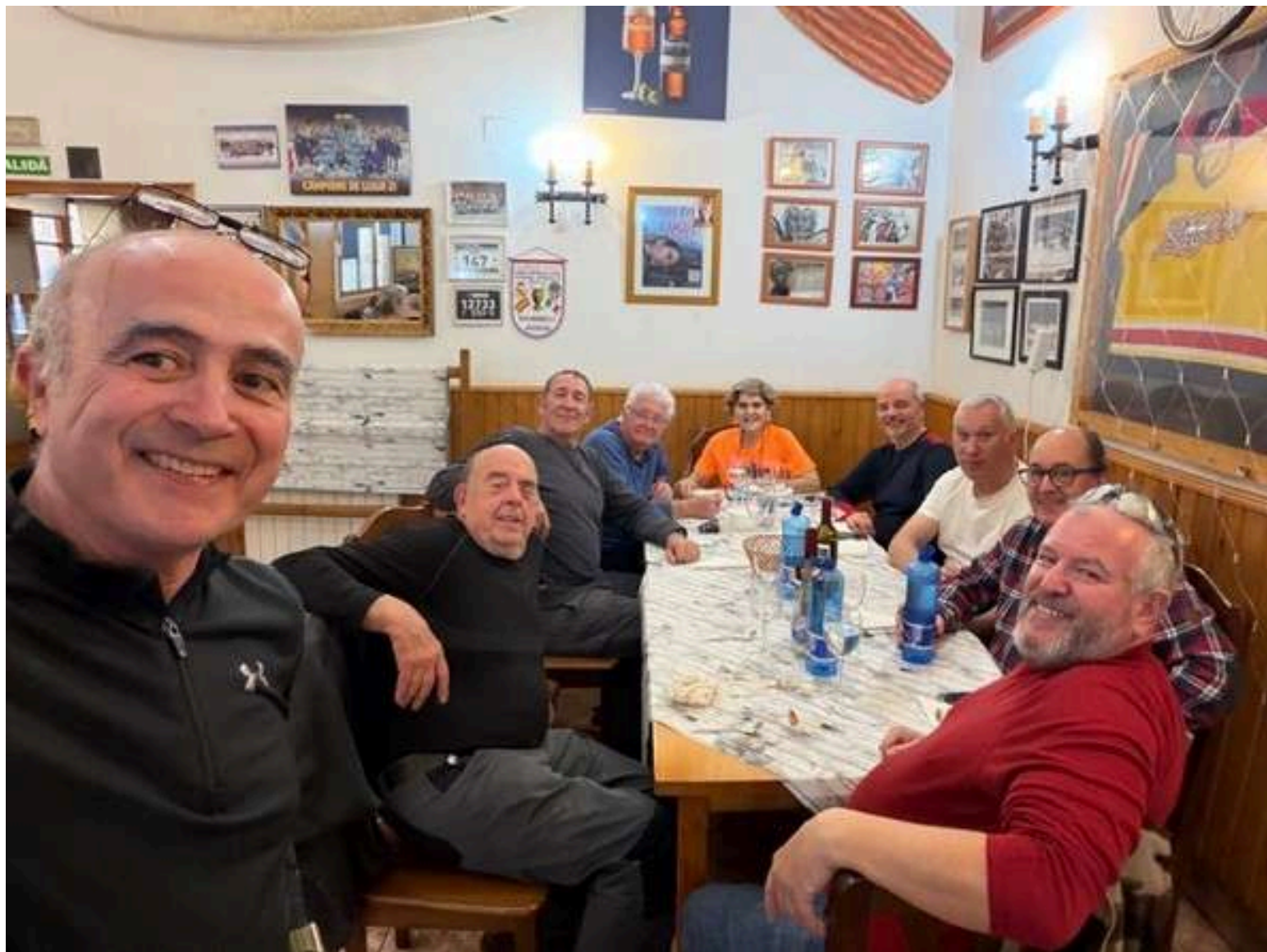
JACA. Comida en el restaurante LA MASÍA. Abajo visita al castillo LA CIUADELA.