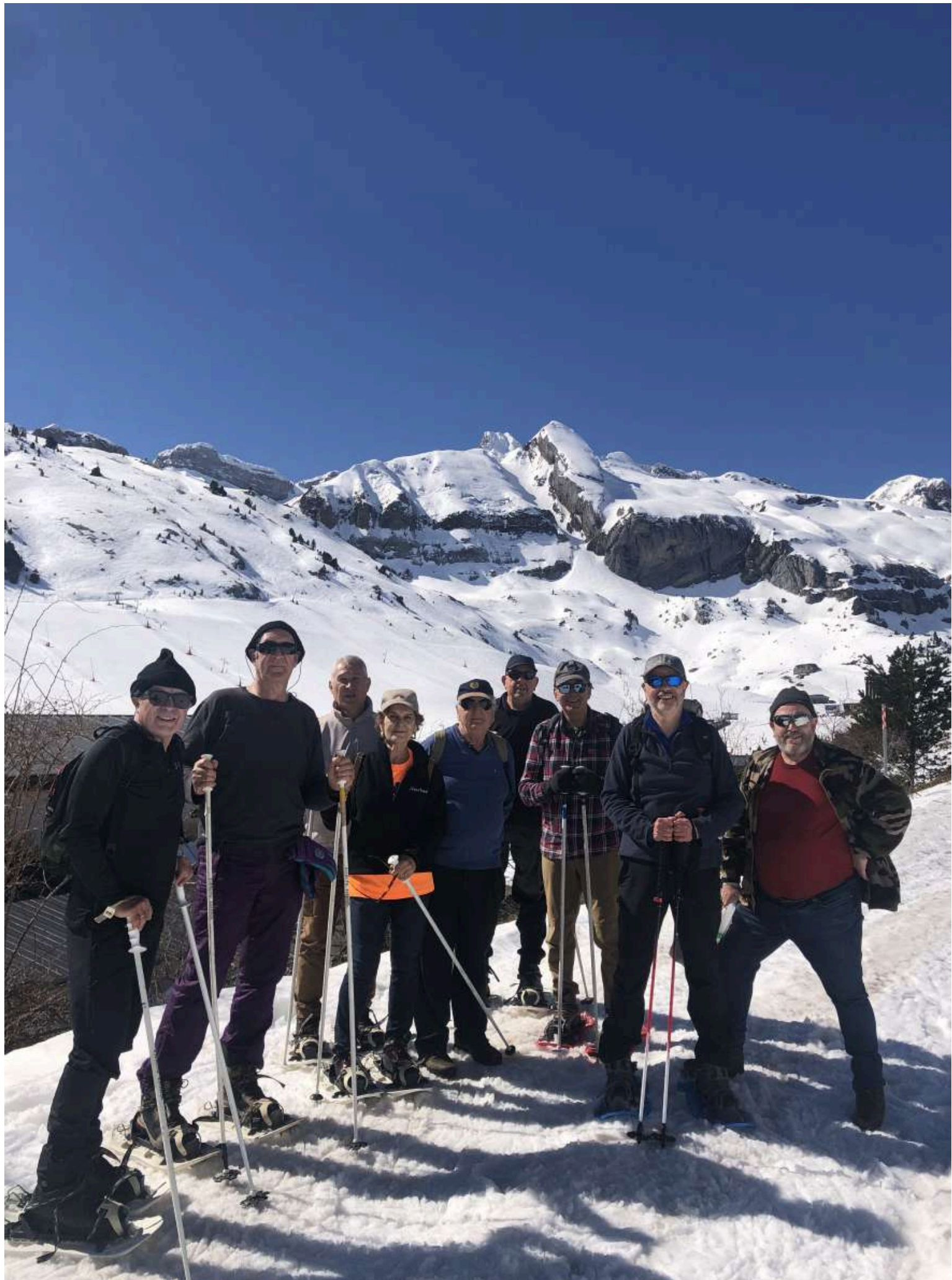
RM. de Candanchú. Los nueve senderistas preparados para iniciar la marcha. De izq a dcha: monte Tobazo, Paso del Pastor, pico ASPE, Tubo de la Zapatilla, LA ZAPATILLA y Rinconada y Ciudad de Piedra