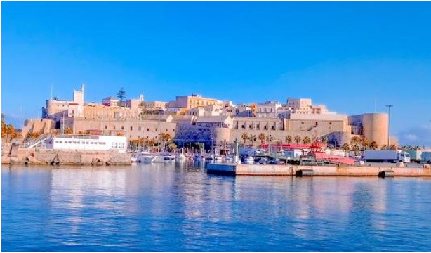
Melilla la Vieja

En el siglo IX un geógrafo llamado Yacubí llamaba a la ciudad como Malilla y en el siglo XIII los Almohades la llamaban Maliliyya.