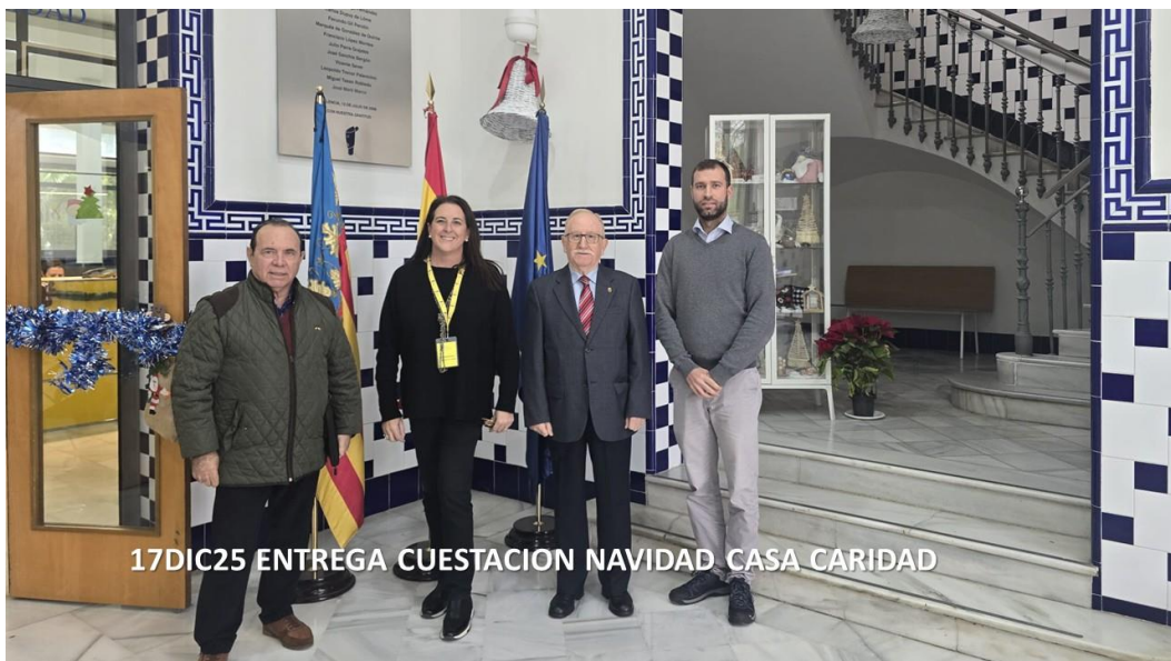
17DIC25 ENTREGA CUESTACION NAVIDAD CASA CARIDAD