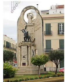
Monumento a los héroes

Después de aquello, dicho cañón fue desplazado y no se sabe cierto donde fue a parar, aunque es muy posible que pasado el tiempo y no habiendo necesidad de él, fuese destruido.