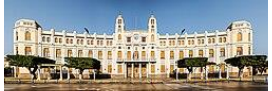
Palacio Asamblea de Melilla