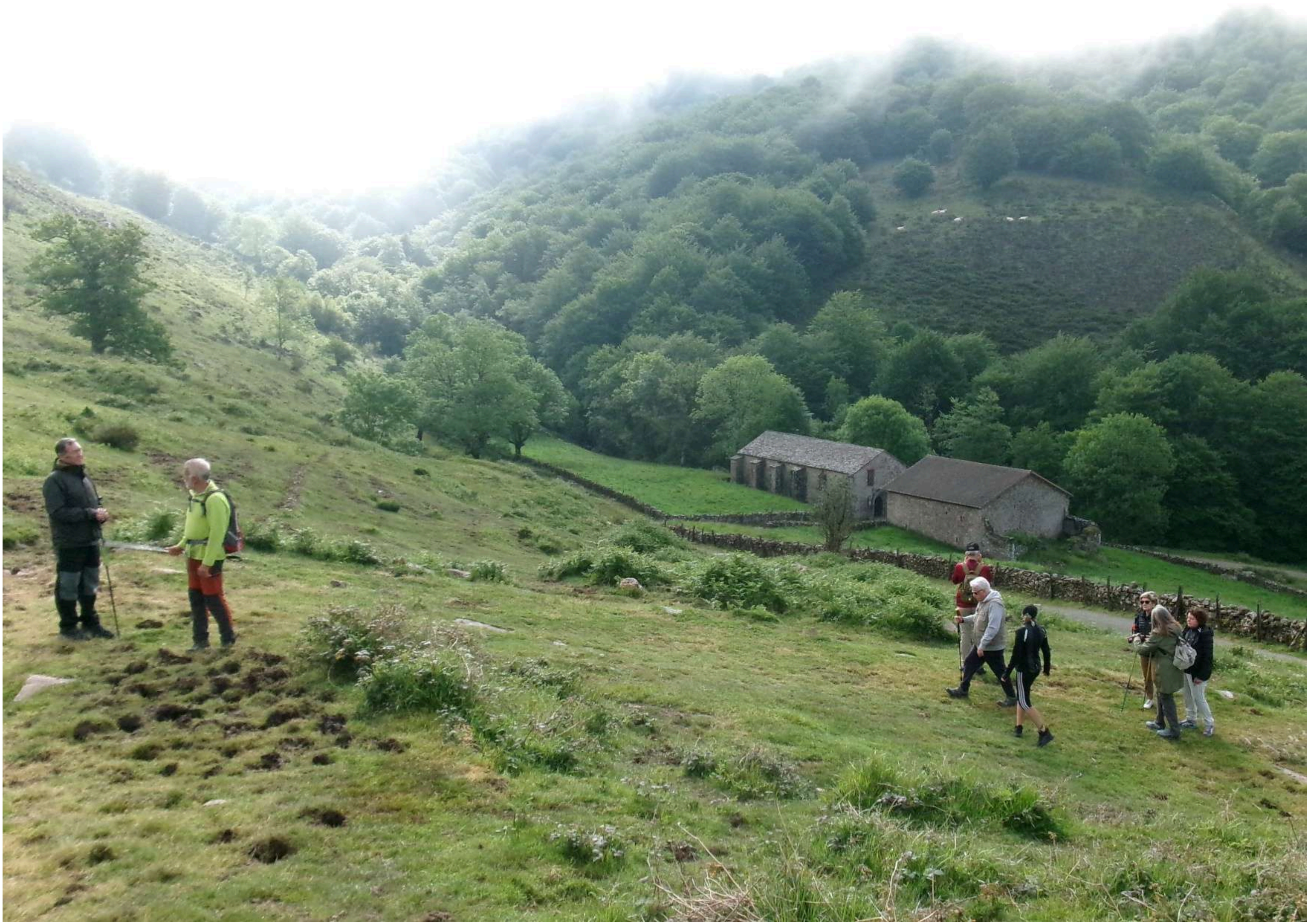
Subida al collado (C.911). Izq-dcha regata de Aratzuri, Monasterio de Velate, Casa Velate y río Ulzama