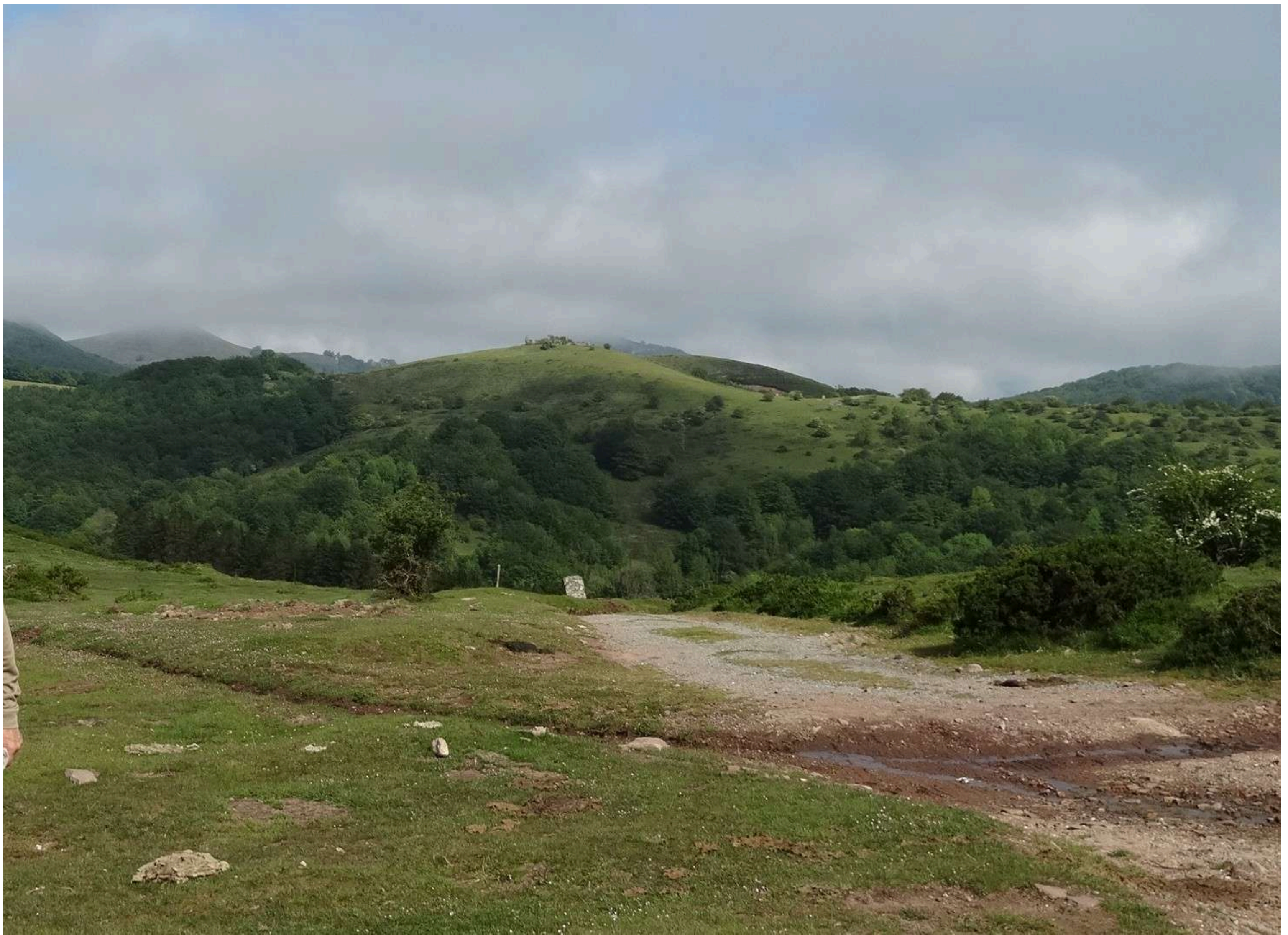
Izq monte Charuta (C.1080), centro ruinas Fuerte de Velate (C.937). Abajo, calzada romana (C° S baztanés)