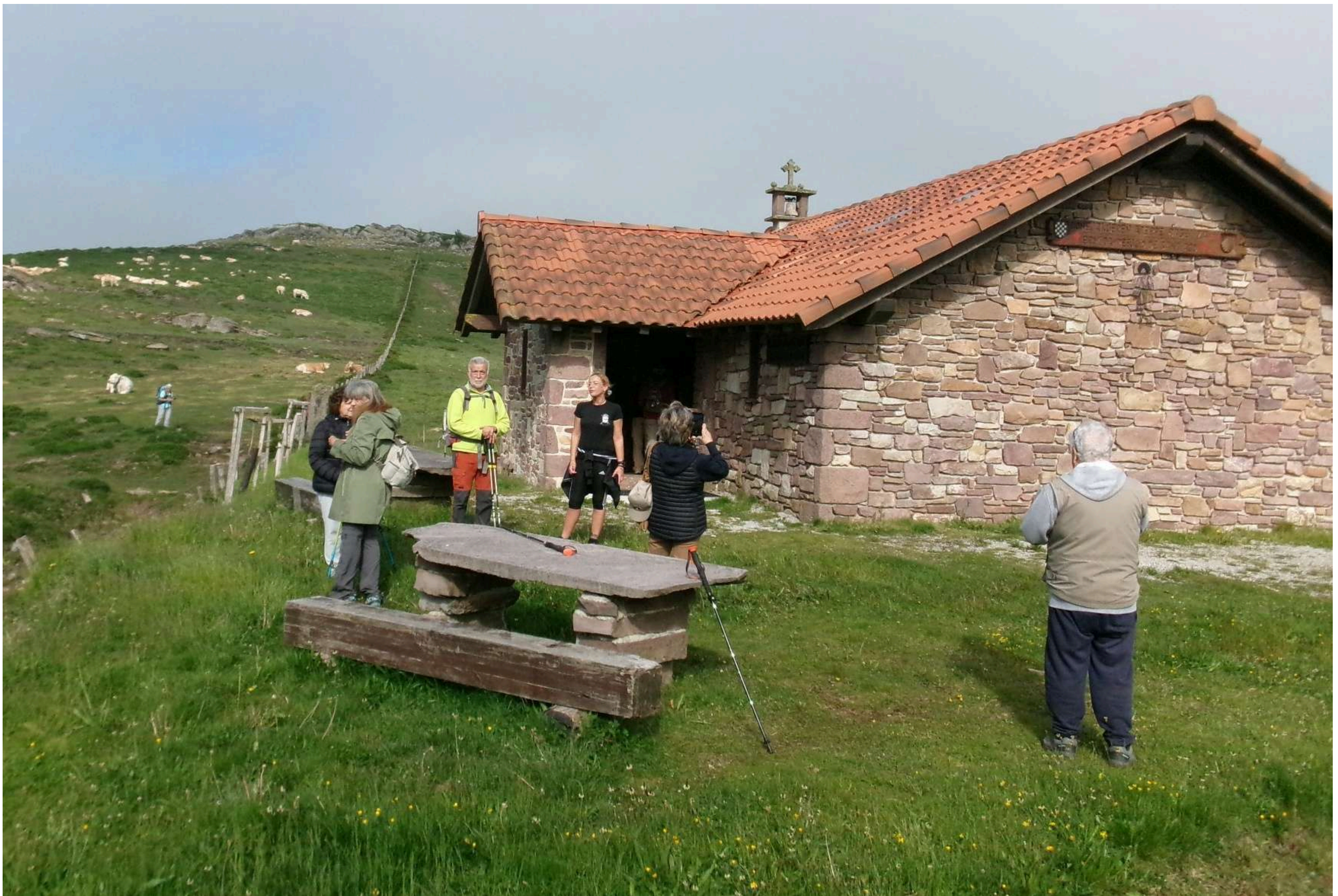
Ermita-refugio de Santiago (Camino de Santiago baztanés). Al fondo monte Matracola (cota 953)