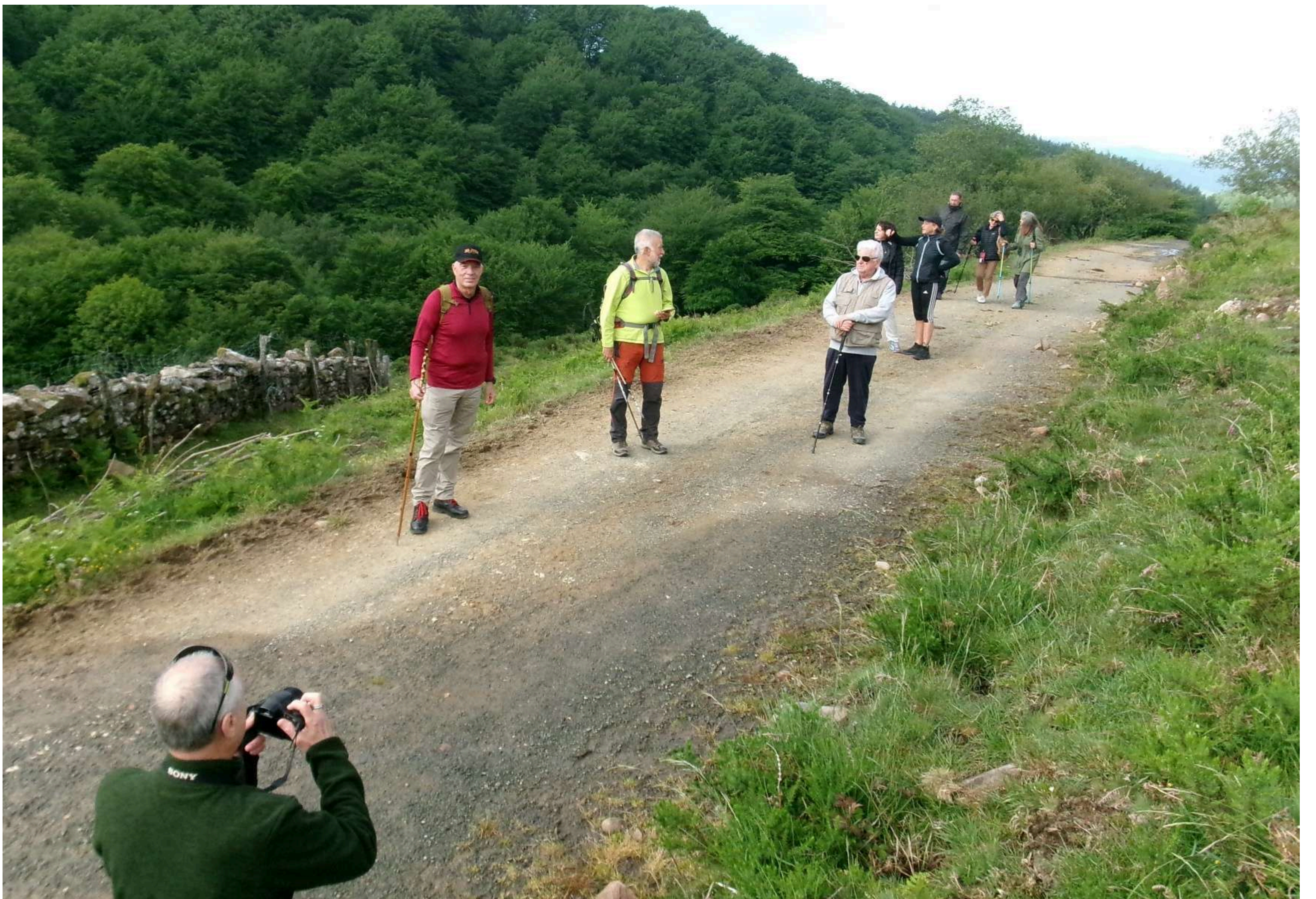
Enlazamos con la antigua calzada romana, a la vista del Monasterio de Velate