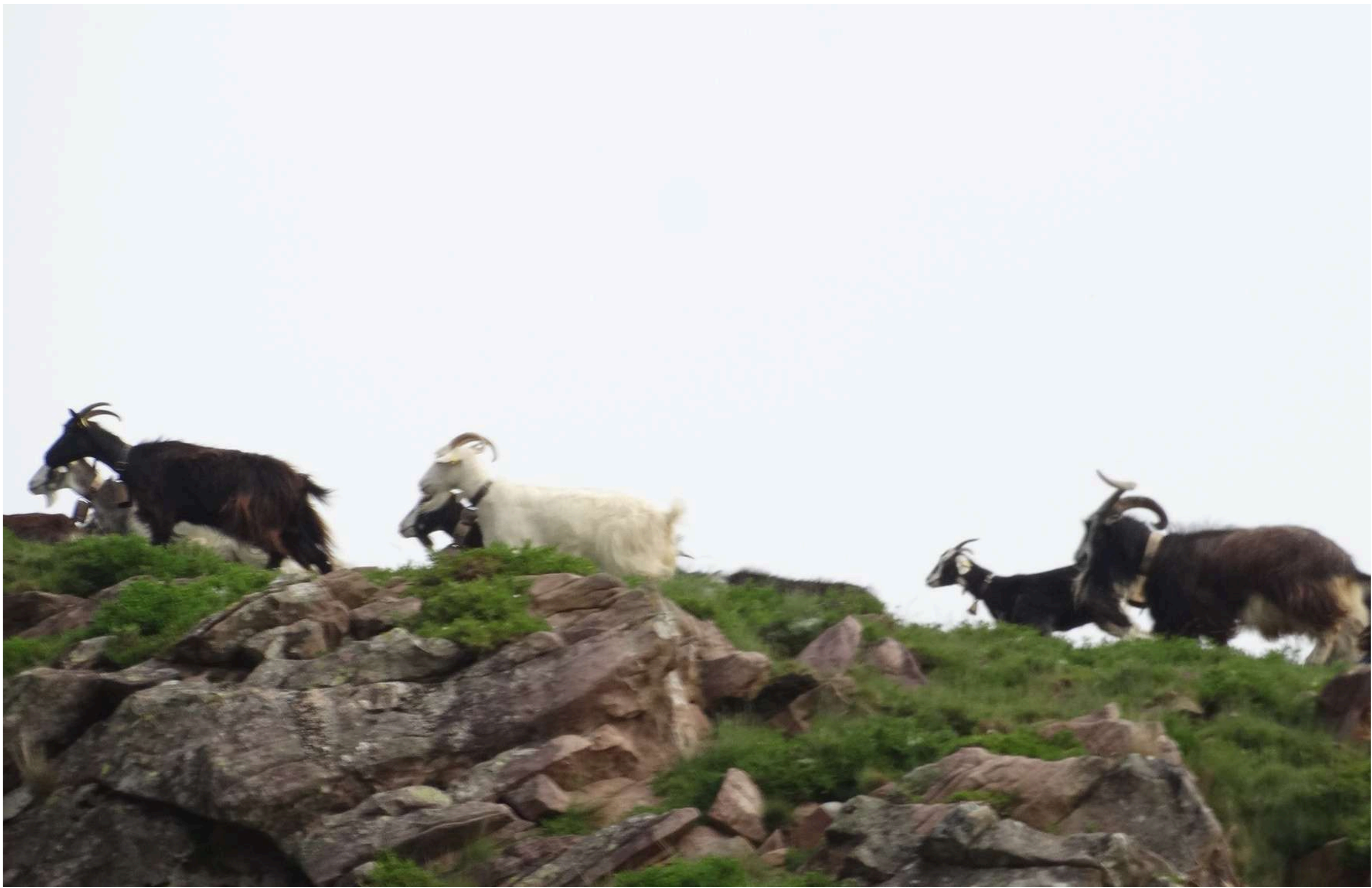
Nos observan y vigilan. Abajo llegada al collado (Cota 911). Ermita-refugio de Santiago (Camino de Santiago