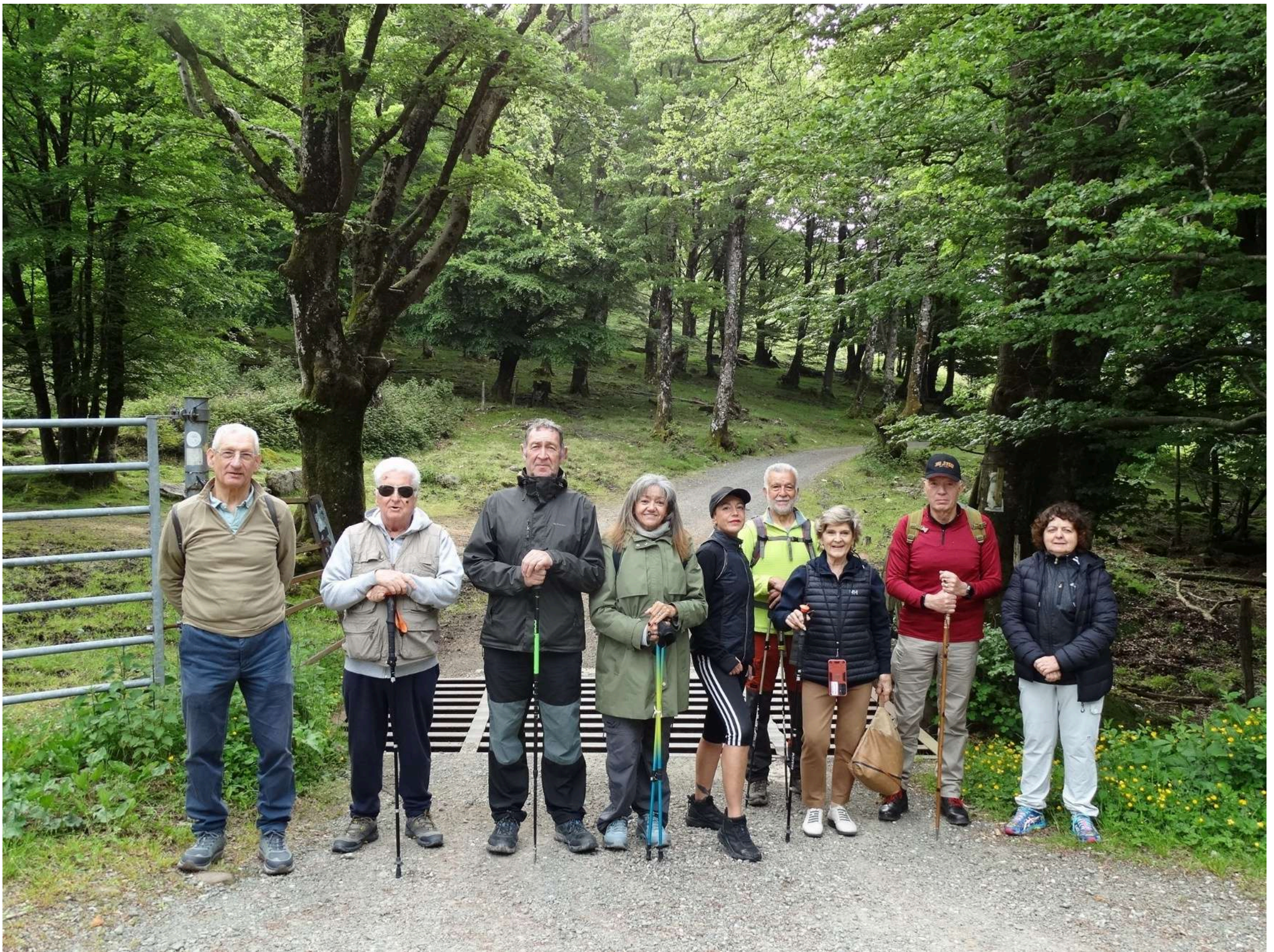
Iniciando la marcha, por la GR-12