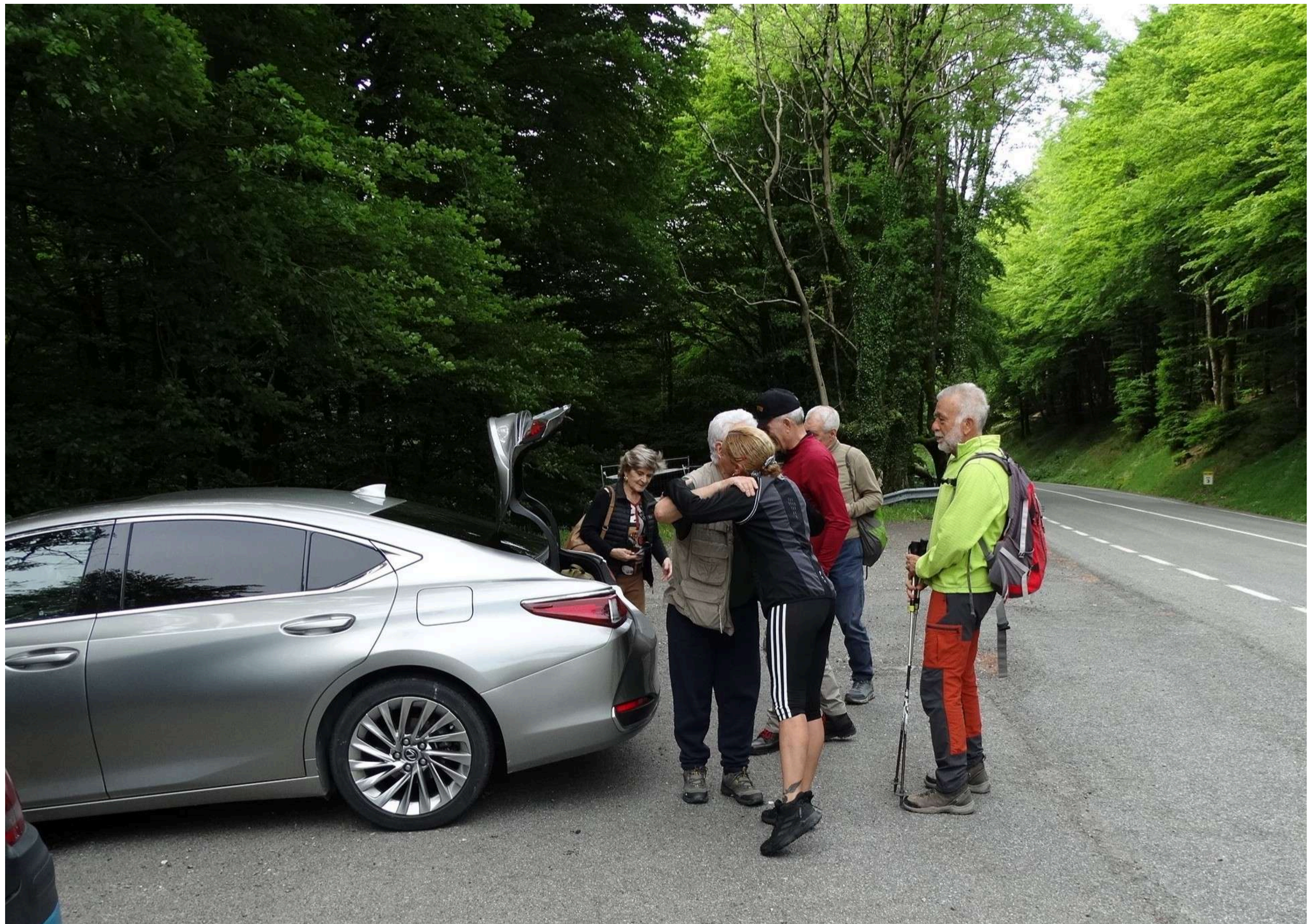
Llegada al Puerto de Velate. Km. 3 de la NA-1210 (cota 815)