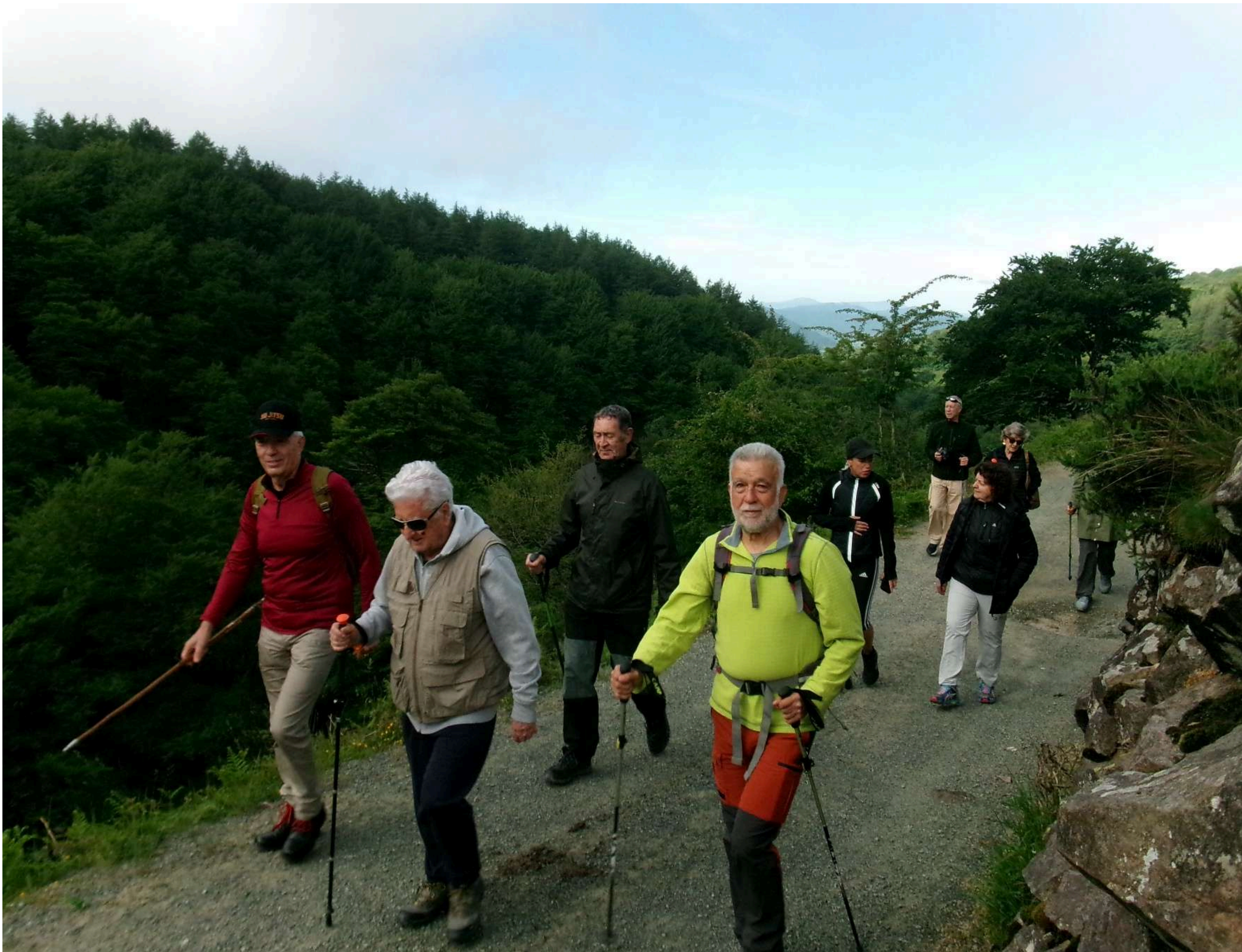
Llegando al Punto Intermedio (cota 850). Abajo, nos observan y vigilan