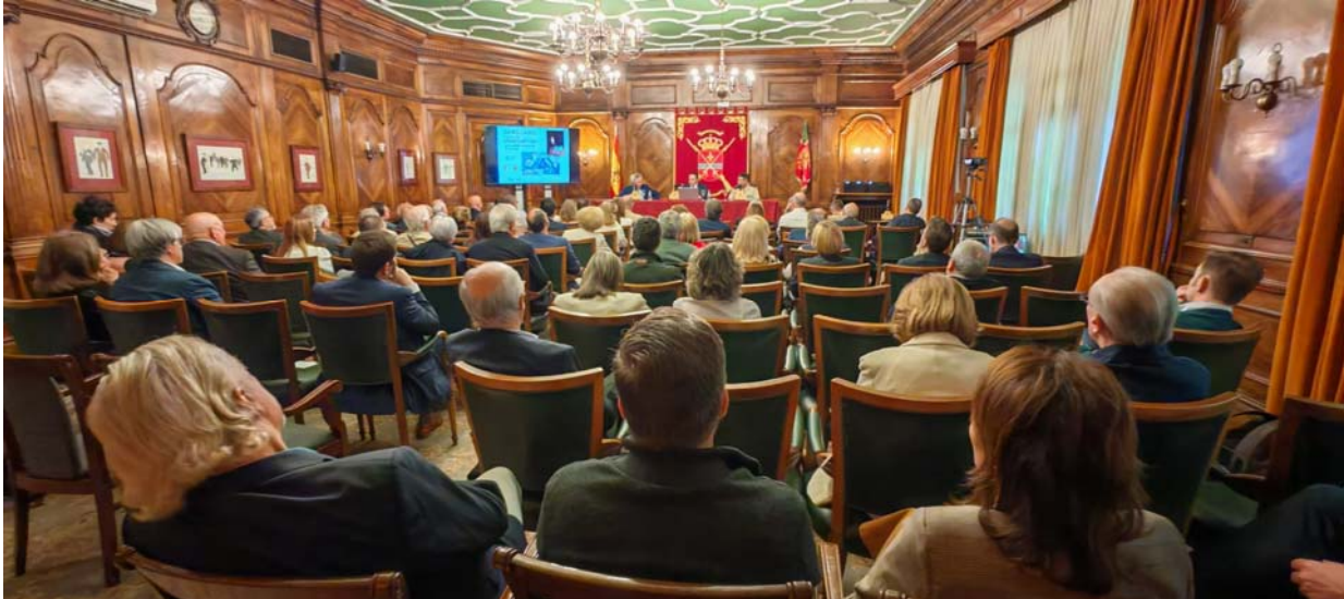
Conferencia celebrada en la Sociedad Bilbaína bajo el título Garellano la Gesta del Gran Capitan