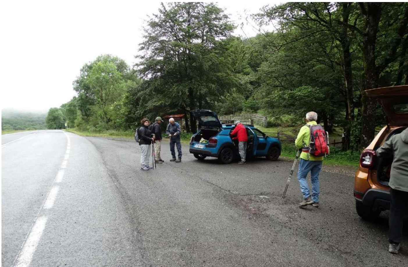
Llegada al Km. 3 NA-1210 (C.815). Puerto de Velate. Abajo preparados para iniciar de la marcha.