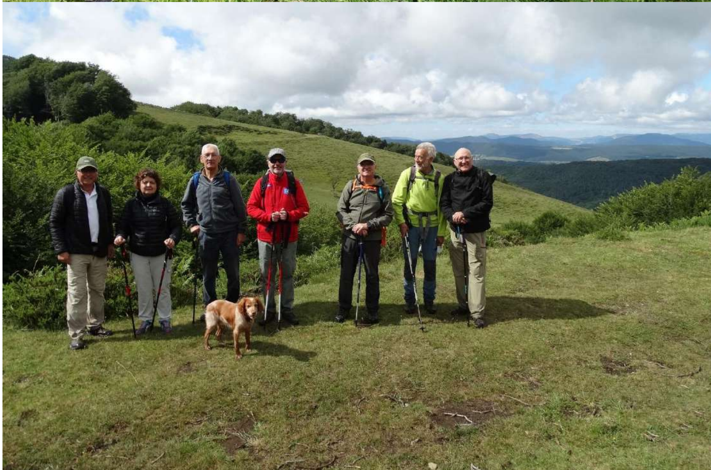
Collado (C.923). Izq. GR-12 sigue hacia el monte Charuta. Al fondo Cabezón de Echañuri, S a Sarbil.....