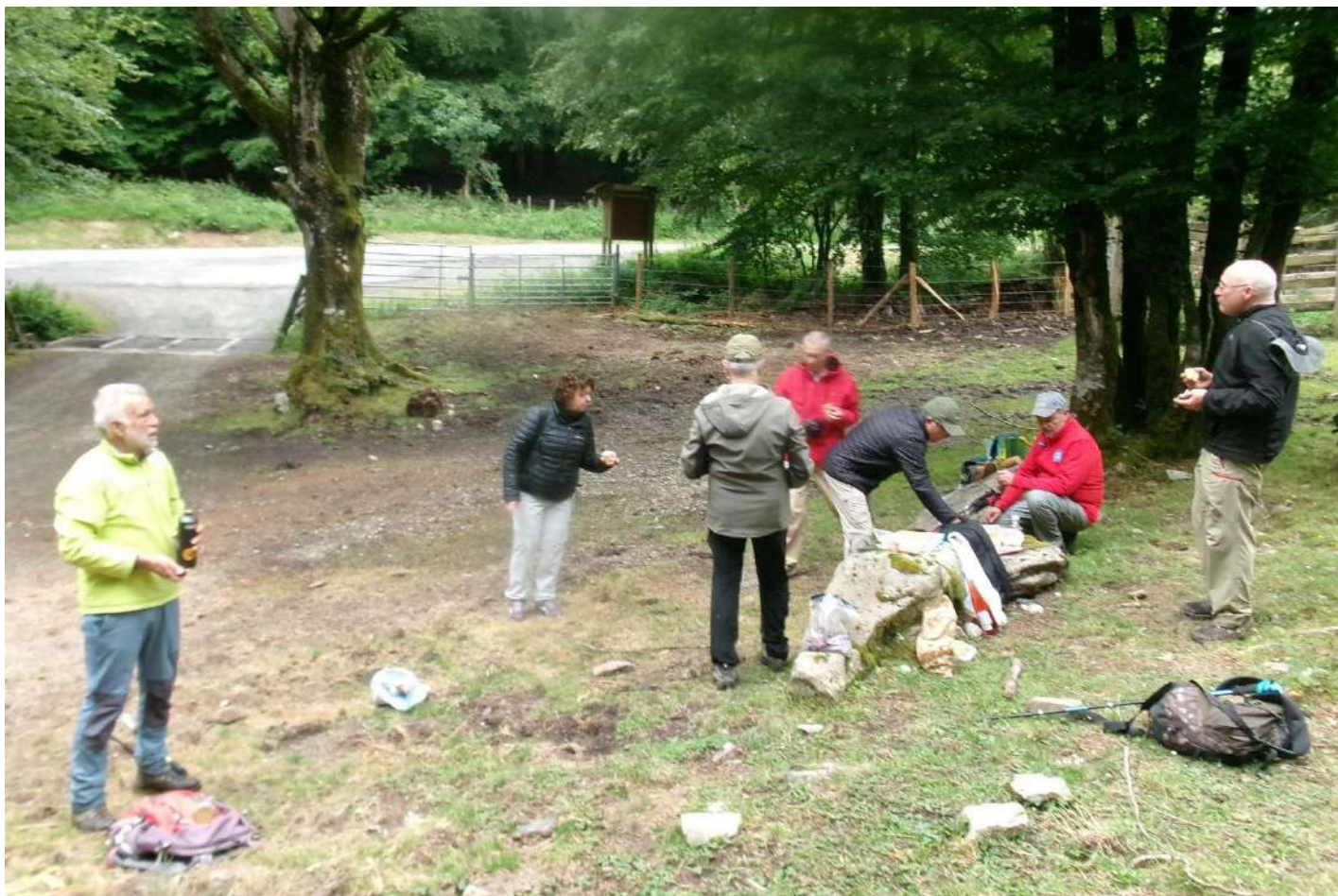
Km. 3 NA-1210 (Puerto de Velate). Almuerzo (compartido) y despedida