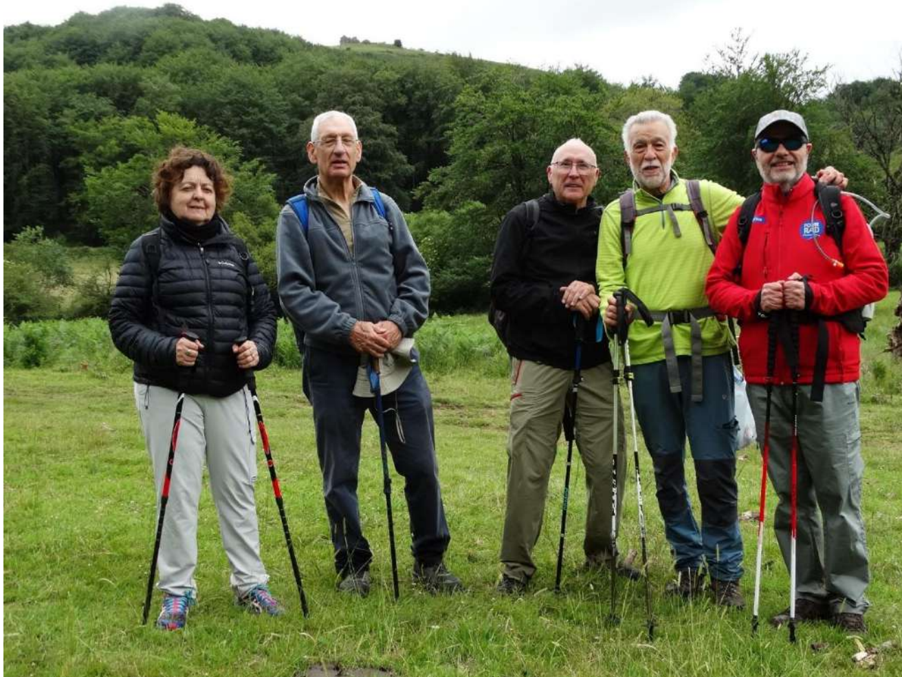
Finalizando la marcha. Al fondo ruinas del antiguo Fuerte de Velate