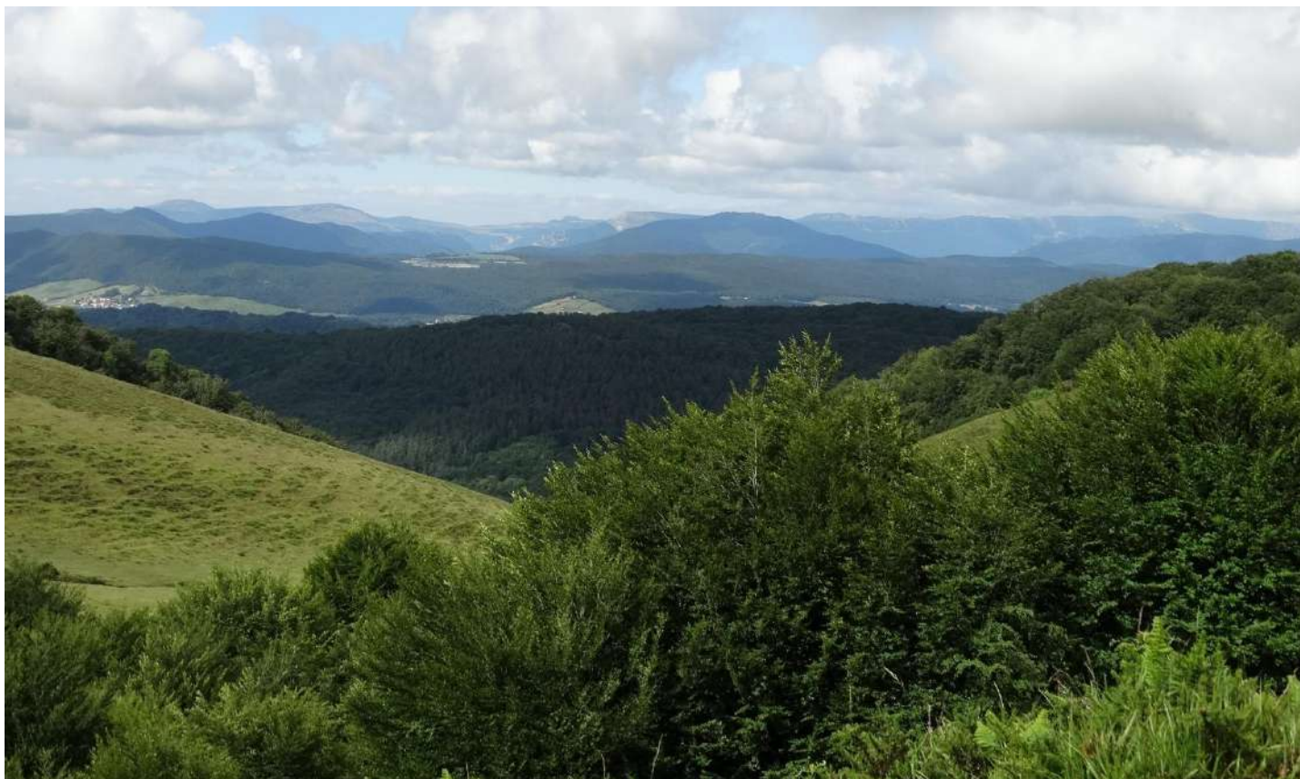
Collado (C.923). Izq a dcha: Cabezón Echauri, S a Sarbil, Altos de Goñi, Alto de Artesa, Churregui, Trinidad de Irurzun y Aralar. Abajo, antenas Telefónica, monte Berriozokoa (C.978). Regreso