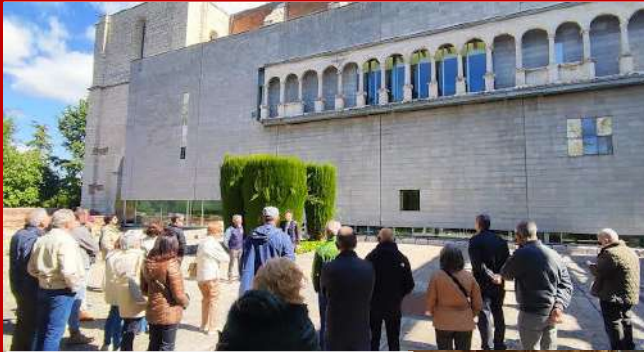
Ruta Arqueológica del subsuelo de Valladolid, 16 de mayo