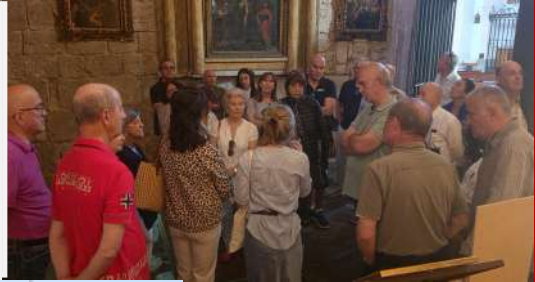
Ruta Arqueológica del subsuelo de Valladolid, 23 de mayo