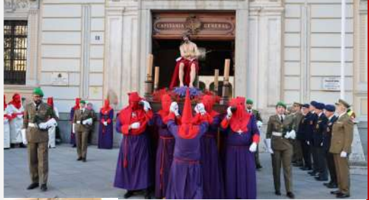
Procesión Cristo de la Misión, 28 de marzo