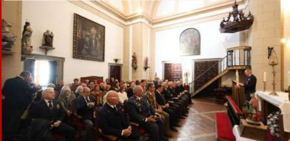
Celebración de San Hermenegildo, 13 de abril