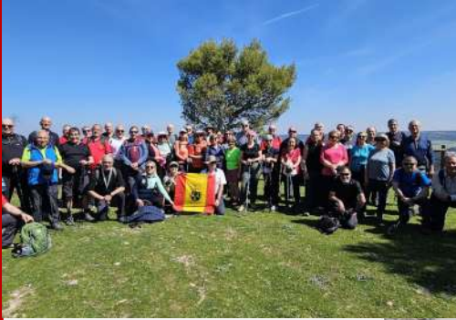
Senderismo, Traspinedo, 25 de marzo