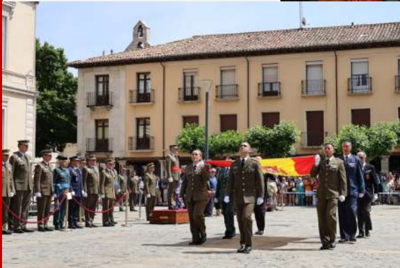
Izado Solemne de Bandera, DIFAS 2026